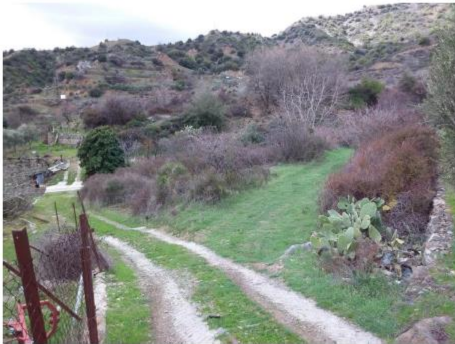
Μέρος του τεμαχίου 45.