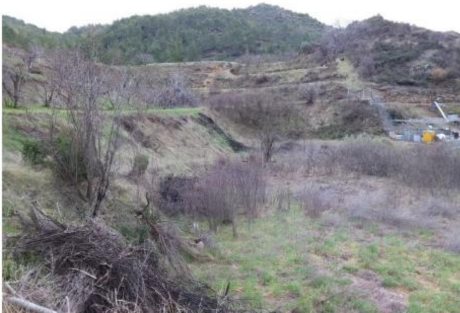
Μέρος του τεμαχίου 629.